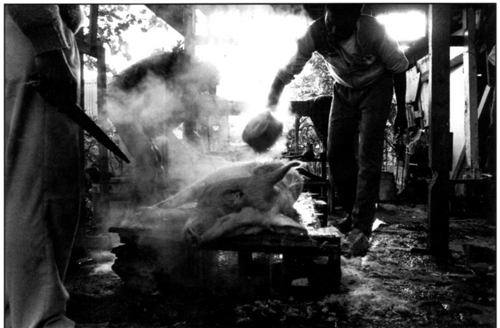
Nettoyage et préparation du cochon

Au départ un jeune "zoreil apprenti photographe", une famille réunionnaise issue d'un milieu défavorisé, et surtout une immense envie de découvrir un milieu, et un mode de vie différents. Représenter et écrire une mémoire photographique sur la vie de cette famille aujourd'hui et demain, lorsqu'elle sera réhabilitée. De cette rencontre va naître le projet photographique de deux ans. Philippe Gaubert