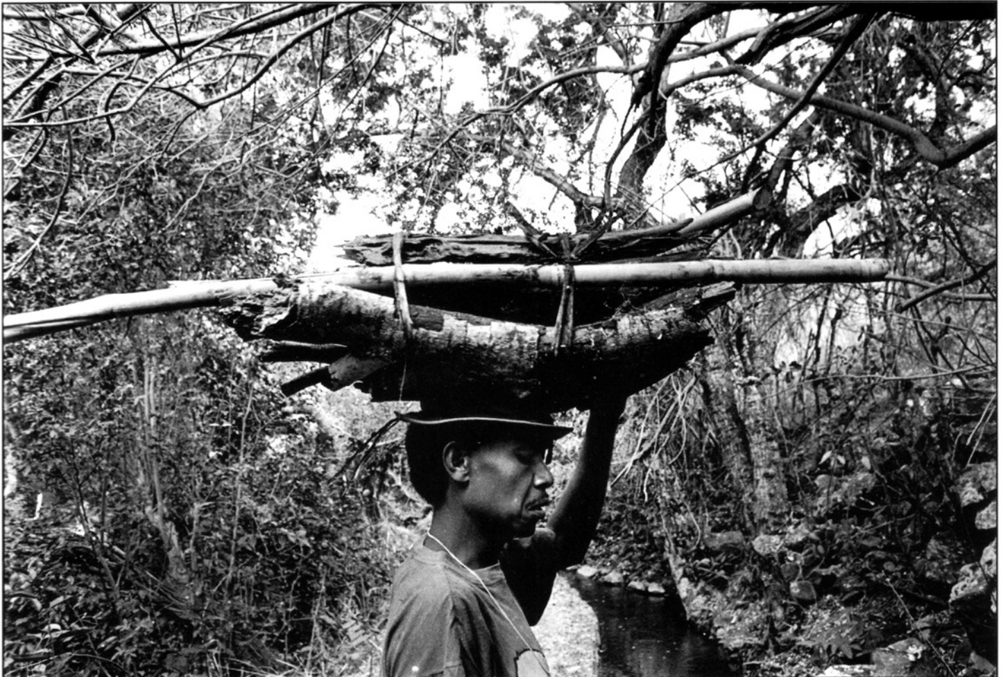
Retour de la corvée de bois

Dans le cadre des Rencontres photographiques du 18ème créées à l'initiative de l'AIDDA et le 18e du mois, Images & Mémoire présente dans chaque numéro du Journal-Affiche des images soumises au Prix de la photographie sociale & documentaire.