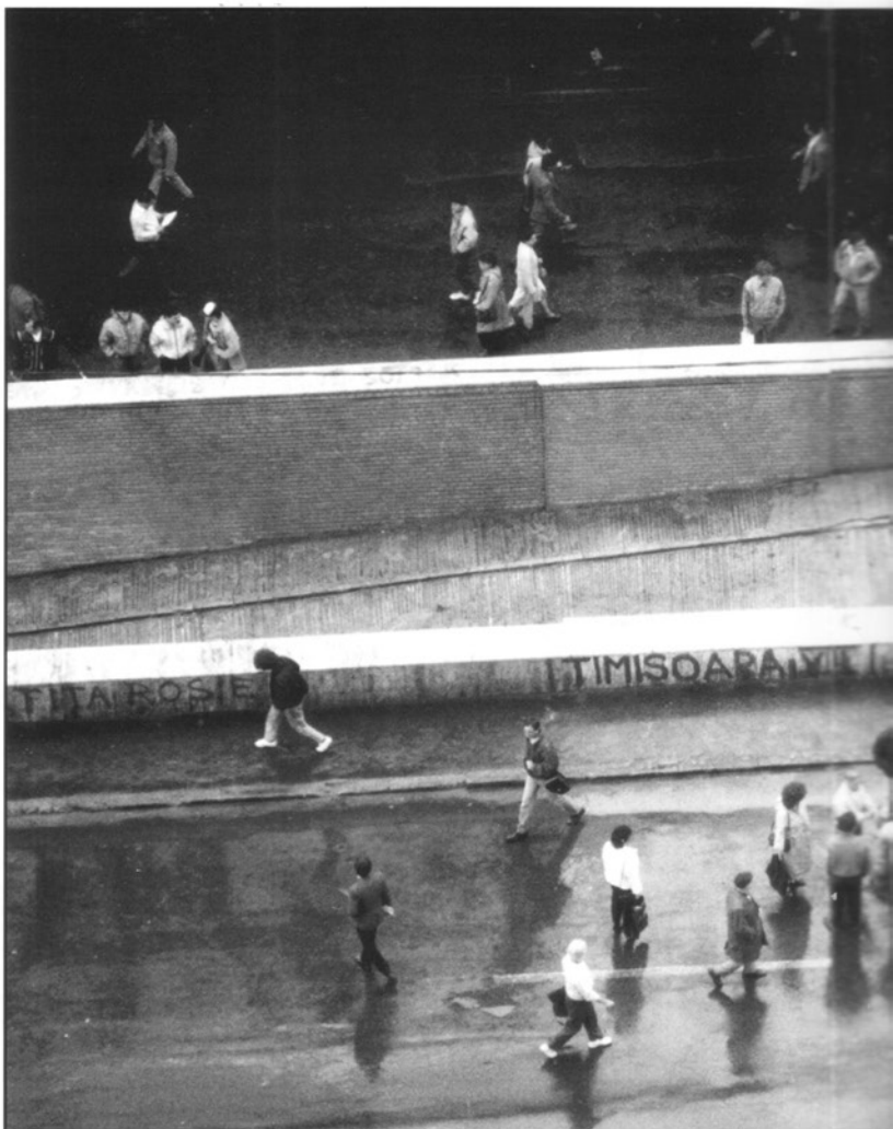
Bucarest, Place principale.