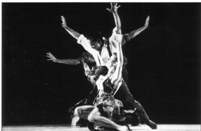
Danse à l'Espace Pléiade.