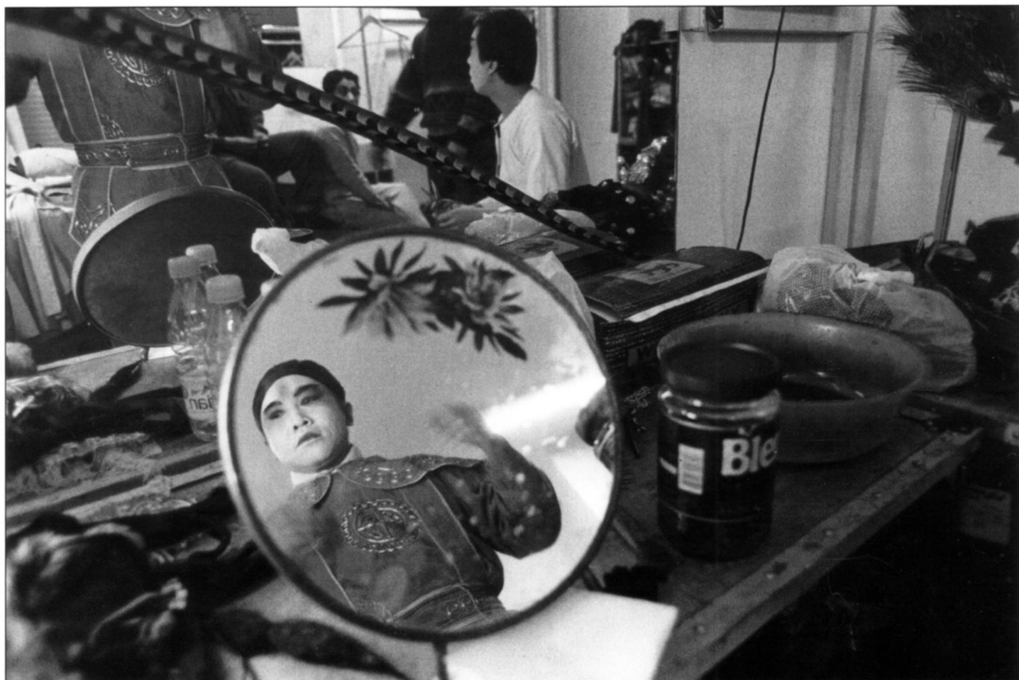
Opéra de Pékin dans les loges du théâtre des Abbesses, 18ème.