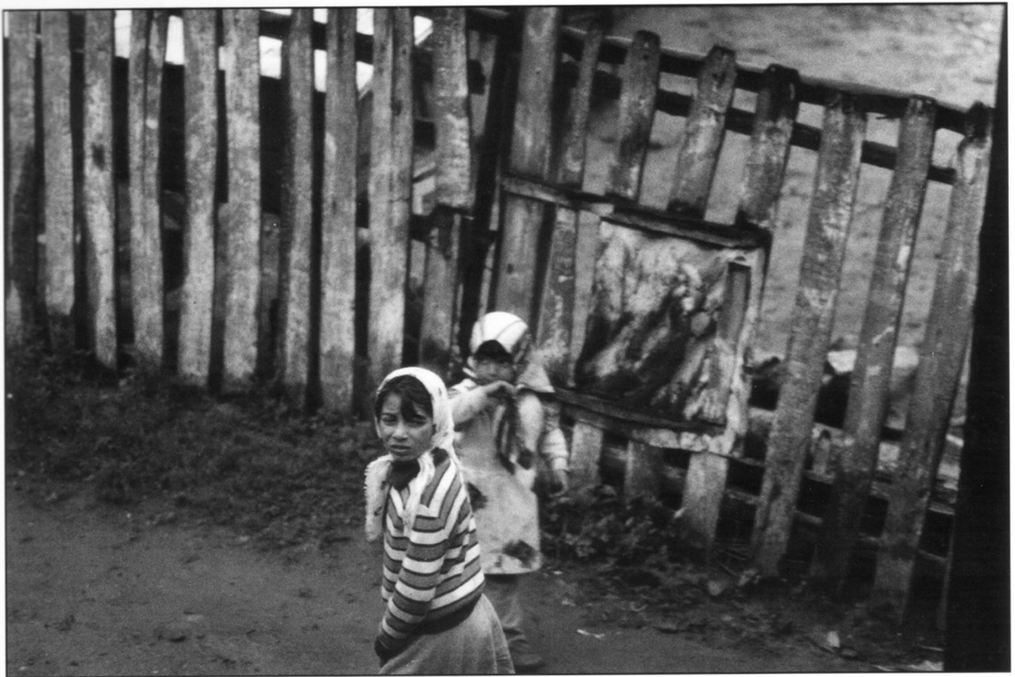
Sur la route entre Bucarest et Clujnapoca