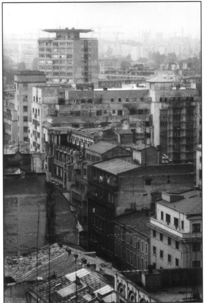
Bucarest, vue de la ville: Bld. Nicole Balcescu