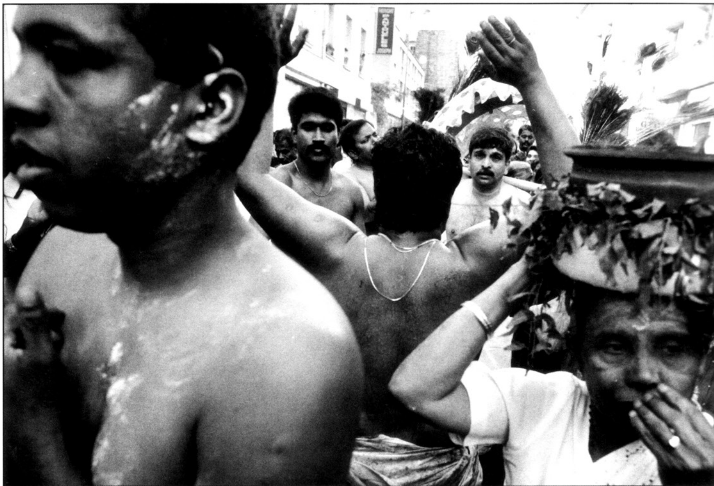
procession de ganesh à Paris.

cinghalaise à la minorité tamoule. Au prix de centaines de victimes mais aussi de milliers de réfugiés qui s'exilent vers l'Europe.