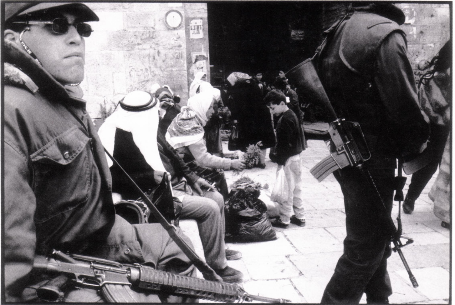
Porte de Damas, Jérusalem-est.