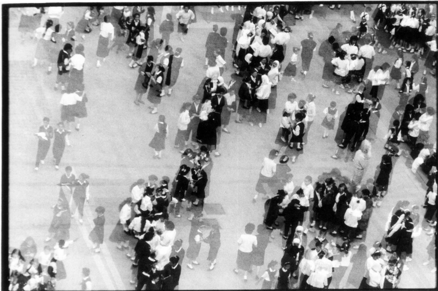
la récré à 'écoe des jeunes filles, Alexandrie, 1990.