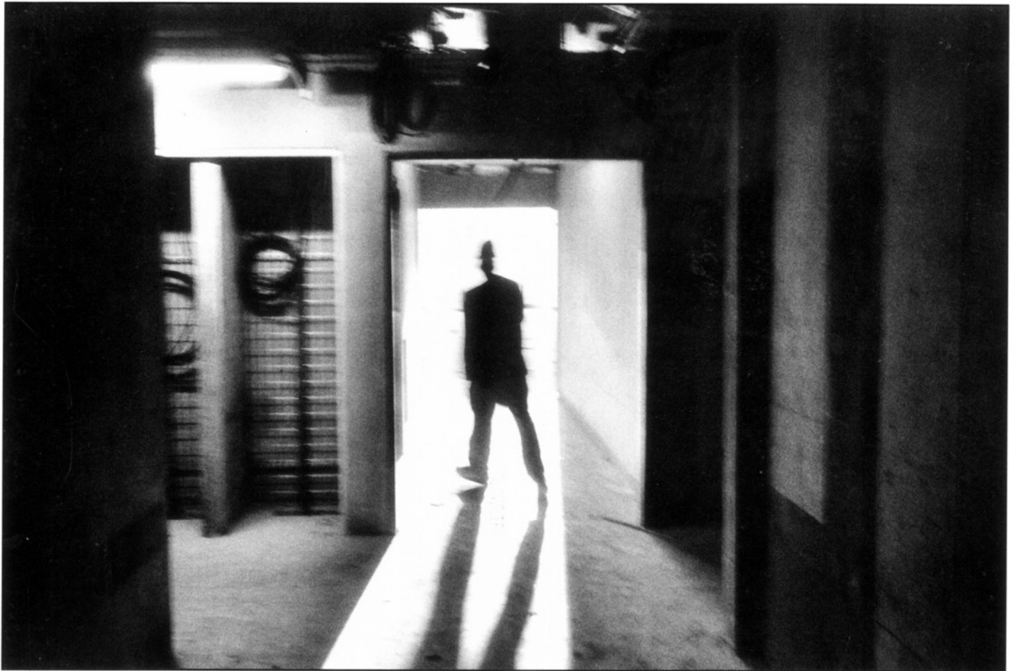
Photo : Claude Dityvon - Chantier. Bibliothèque Nationale de France, 1992.