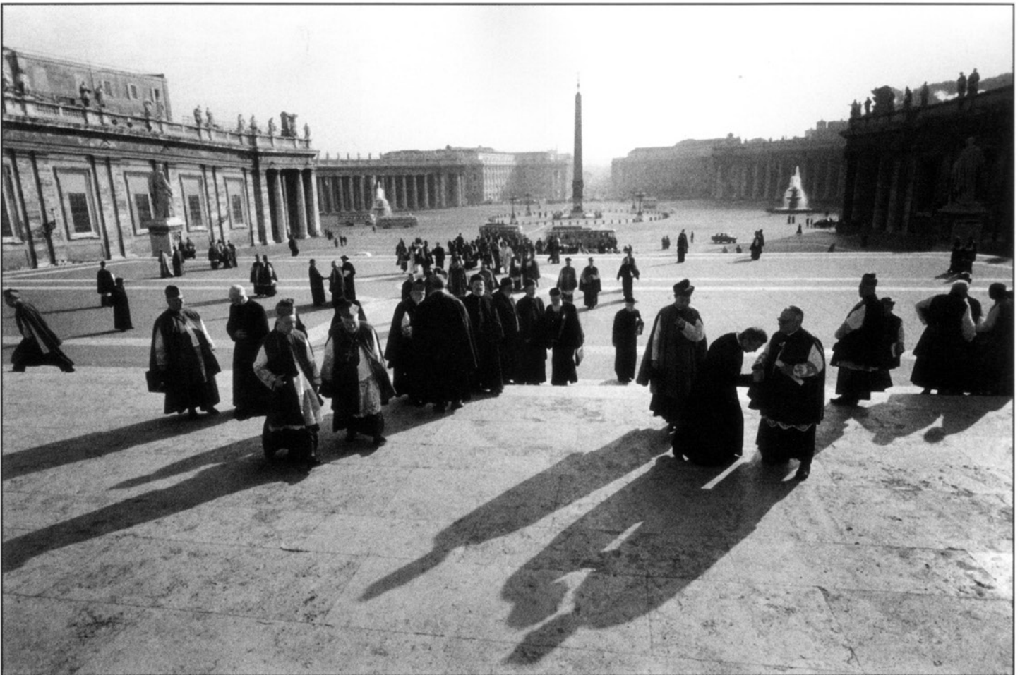
Photo : Jean-Philippe Charbonnier. Le concile Saint Pierre de Rome, huit heures du matin, 1963.

diversité d'une société et du monde, où l'on retrouve tout ce que nous renvoie la crise actuelle, mais aussi où émergent des dynamiques citoyennes, culturelles et humaines comme réponse au désespoir et aux défis des années 2000.