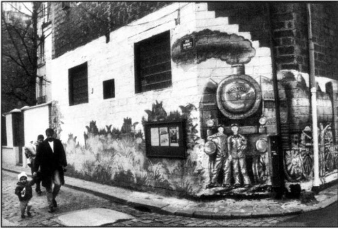
La Moskova, 18ème, 1991